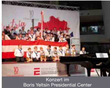
Konzert im Boris Yeltsin Presidential Center

Erste Station war Jekaterinenburg, auf der asiatischen Seite des Ural gelegen, um auf Einladung des Österreichischen Honorarkonsuls Andrey Kozitsyn im Boris Yeltsin Presidential Center zum